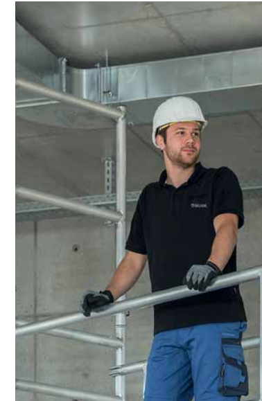
Abb. Bestell-Nr. 27991

Hinweis: Nach DIN EN 1004 werden zum sicheren Auf- und Abbau von Gerüsten zwei Montagesicherungsgeländer benötigt.